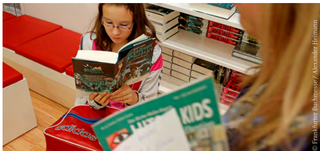
© Frankfurter Buchmesse / Alexander Heilmann

Im Roman prallen zwei Welten aufeinander: wohlbehütete Gymnasiastinnen auf taffe Hauptschüler. Im Gepäck: jede Menge Vorurteile. Dass dabei Humor und Sprachwitz nicht zu kurz kommen, versteht sich bei Slam Poetrist Jaromir Konecny von selbst.