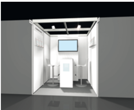
Systemstand Smart 4 qm