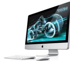
Apple iMac 21,5"