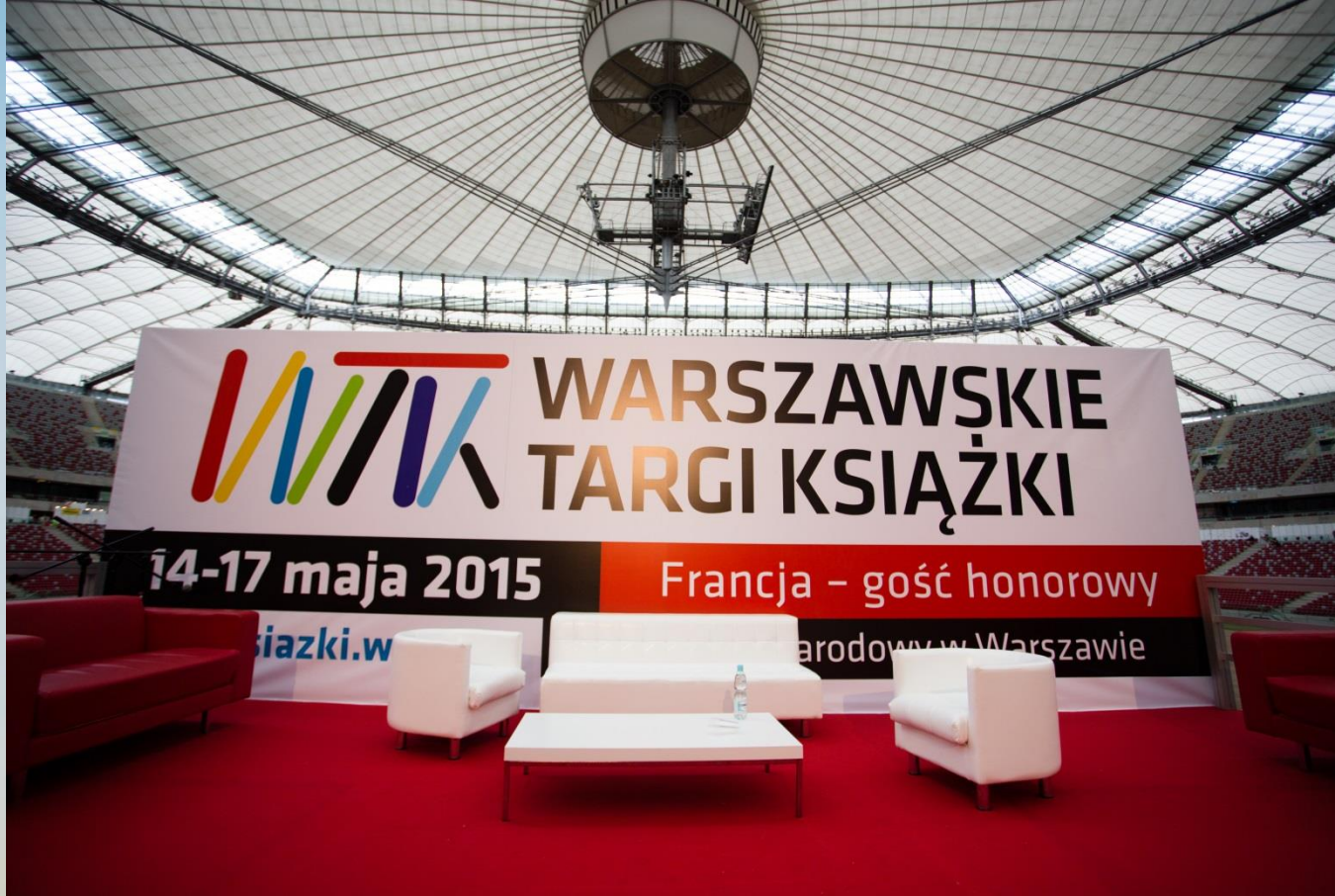
Warschauer Buchmesse 2015